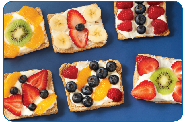
Recipe and photo from Cooking Matters

In a small bowl, mix together cream cheese and milk with a fork until smooth. Stir in honey and vanilla. Spread a generous spoonful of cream cheese mixture on each piece of cracker or toast. Arrange about 1/3 cup of fruit on each tart.